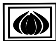
Asociación de Productores y Empacadores de Ajo de Mendoza